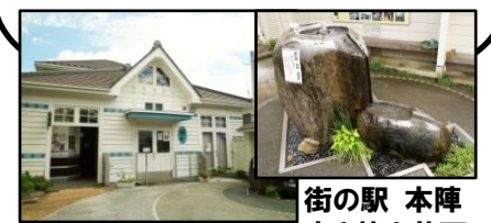
街の駅 本陣 突き抜き井戸