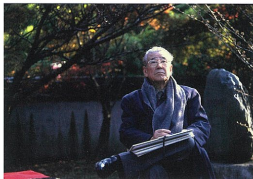
(洛中洛外スケッチの旅・南禅寺にて)

平山郁夫の人気は没後10年を過ぎても燦然と輝き、衰えることを知りません。シルクロードを題材とした作品が有名ですが、平山がシルクロードへ向かったのは、玄奘三蔵の求法の道を進むことによって始まったものであり、さらには、日本古来の文明や歴史を紐解くためであったといえましょう。