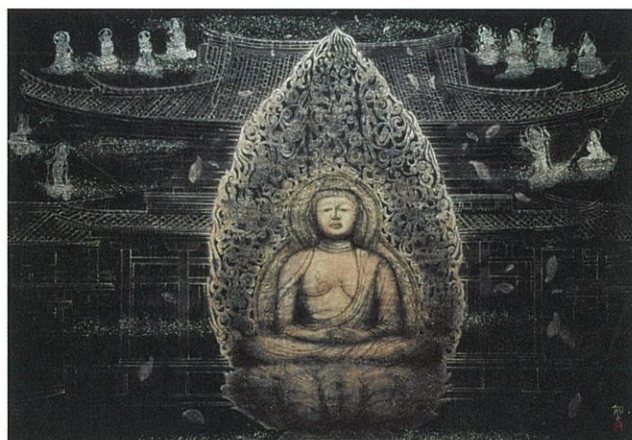
浄土幻想 宇治平等院 平成16(2004)年