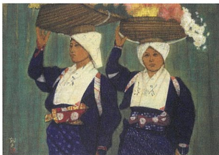
浄花白川女 母娘 平成16(2004)年