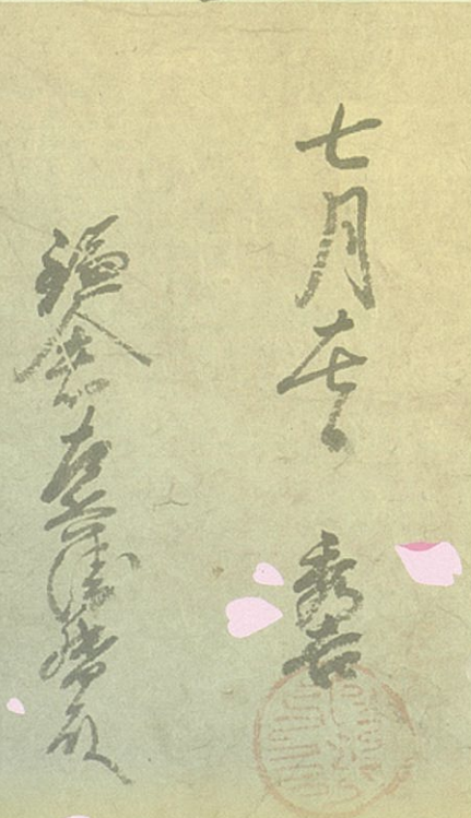
豊臣秀吉朱印状 (天正18年)7月17日 神奈川県立歴史博物館所蔵